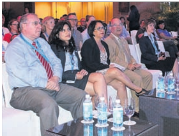
Continuacion di front

Minister kier leyman ecologico na interes di industria turistico